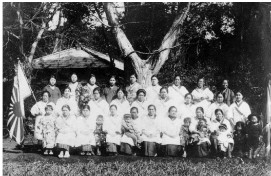
軽井沢国防婦人会(昭和15年ころ)

「この世界の片隅に」は、広島・呉を舞台に、戦争という残酷な歴史の流れの中での「かけがえのない日常生活」を描く話題作です。同じ時代、鎌ヶ谷の人々はどのような生活をしていたのでしょうか。郷土資料館学芸員が、日頃の調査・研究の成果を、画像も交えて分かりやすく紹介します。